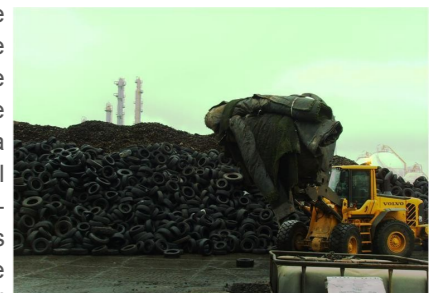
Fig. 1: Transporte dos rolos de tapete