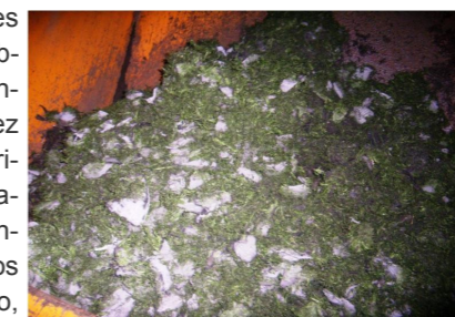
Fig. 4: Produto final

Devido à baixa densidade dos componentes do tapete, verificaram-se algumas obstruções à saída do túnel criogénico e à entrada dos moinhos de martelos. Uma vez que os entupimentos no equipamento obrigaram a uma intervenção manual dos operadores, os fluxos de material foram substancialmente menores, quando comparados com os fluxos normais (de pneus). Contudo, o produto final foi obtido sem dificuldades acrescidas, Fig. 4.