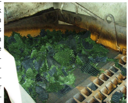
Fig.2: Rolos de tapete cortados