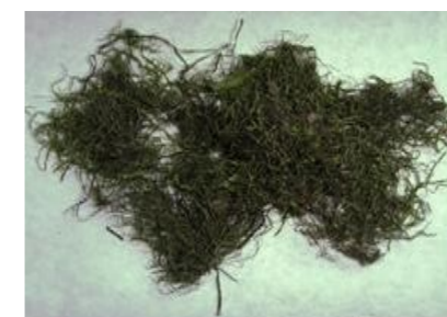
Fig 5.a.: Filamentos não moídos