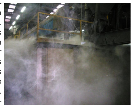
Fig. 3: Linha criogénica

Aspectos-chave Programa: ECO-INNOVATION Orçamento: 940.018€