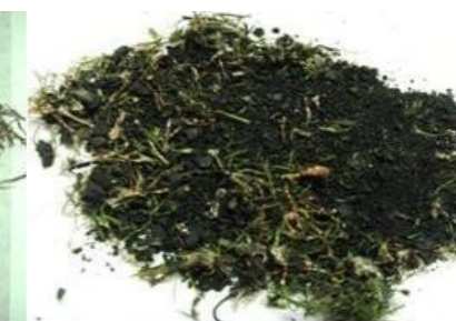
Fig 5.b.: Backing do tapete moído

De acordo com esta primeira experiência, o processo criogénico provou ser viável e promissor no que respeita à reciclagem de tapetes de relva sintética e à quase completa separação dos diferentes materiais poliméricos que as constituem; no entanto, será necessária uma optimização mais completa do processo, incluindo um método de densificação que permita a compressão dos materiais mais leves.